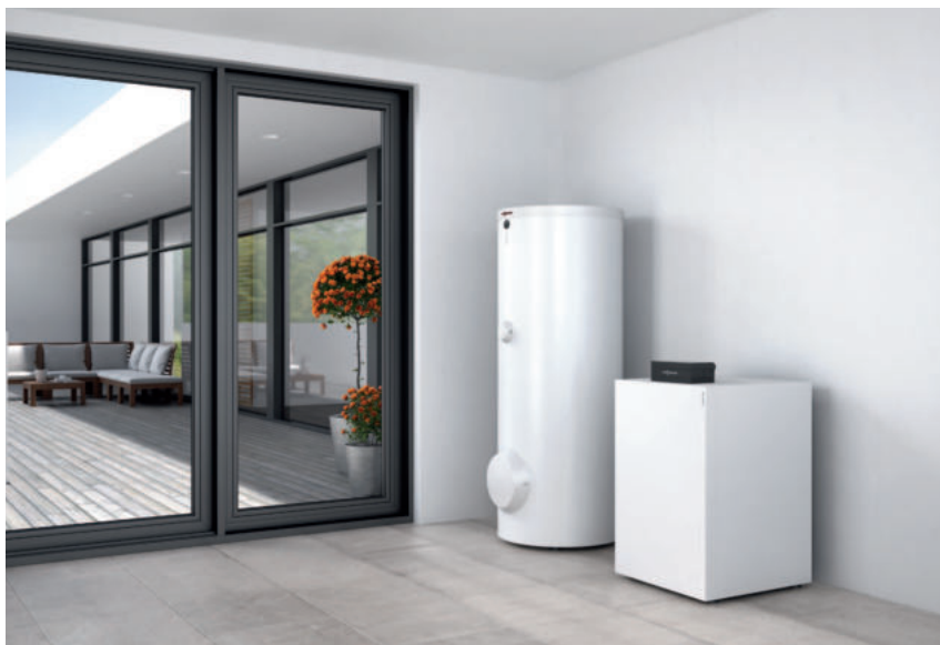
Pompa ciepła Vitocal 300-G z pojemnościowym podgrzewaczem c.w.u. Vitocell 100-W (poj. 300 litrów)